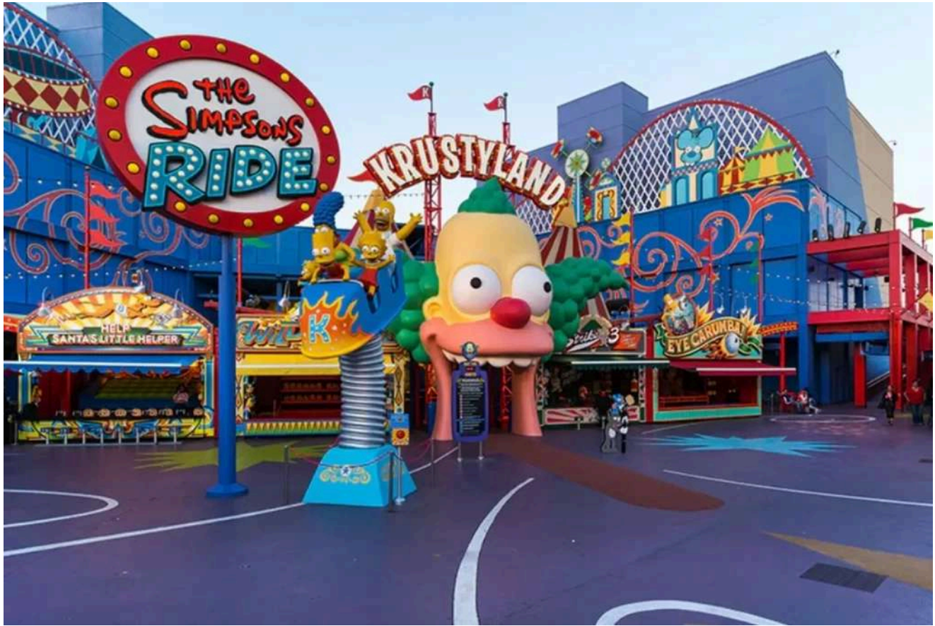
A atração The Simpsons Ride é um dos melhores brinquedos do Upper Lot