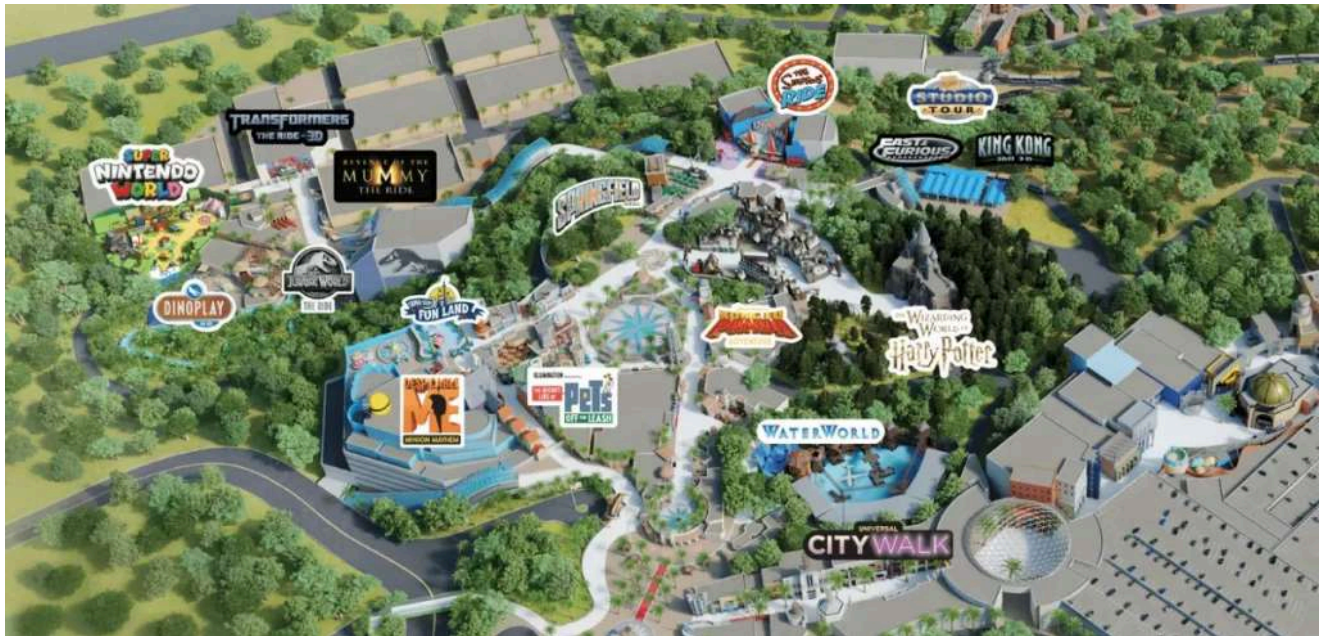
Mapa do Universal Studios Hollywood

Pronto pra viver seu dia de estrela de cinema na Universal Studios Hollywood ? Com esse roteiro em mãos, você vai aproveitar cada segundo sem perder tempo com filas. Boa viagem e aproveite o melhor da Califórnia! 😎 Se precisar de alguma dica extra, me chama no WhatsApp ou me escreve no ana@orlandoparabrasileiros.com que eu sempre respondo!