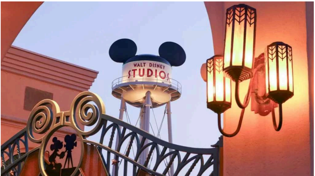
Um dos ícones da Disneyland Paris que homenageia a história da Disney e do cinema .