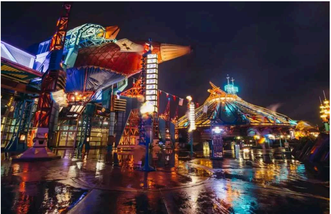
Um verdadeiro espetáculo futurista na Disneyland Paris ao anoitecer.