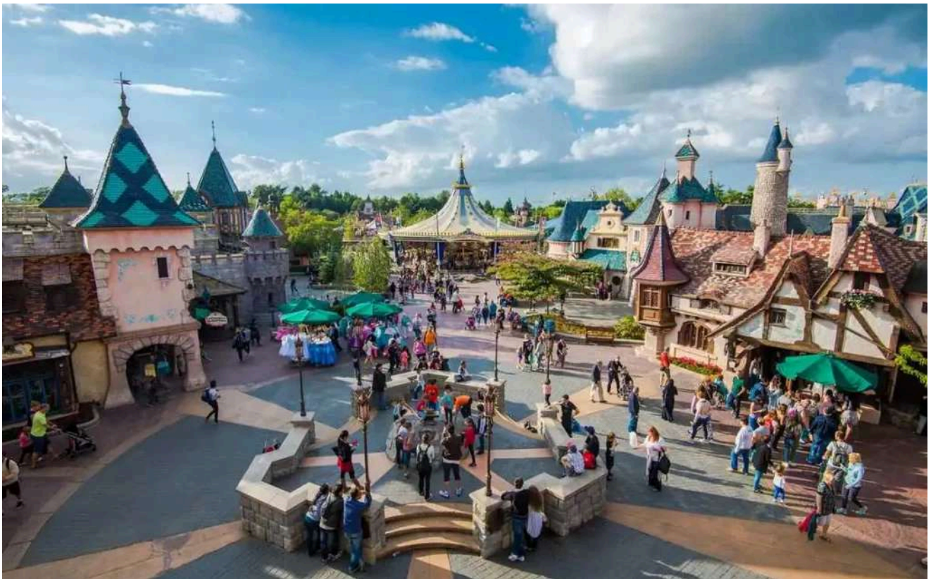
O pôr do sol deixa a Fantasyland ainda mais encantadora.