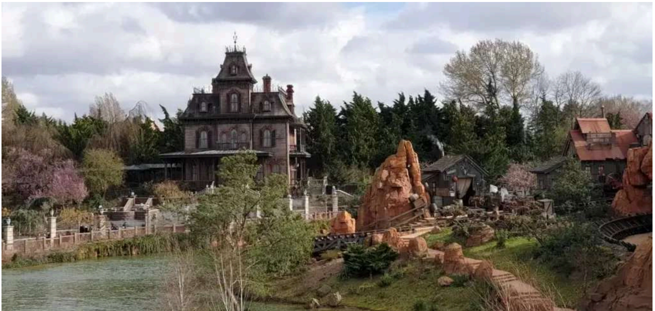
Mistério e emoção nesta clássica atração sombria da Disneyland Paris.