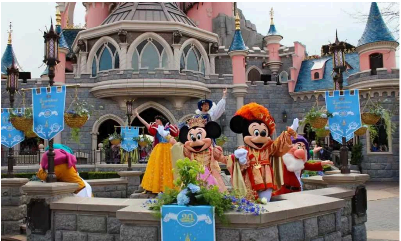
Mickey e Minnie em um momento especial de comemoração na Disneyland Paris .