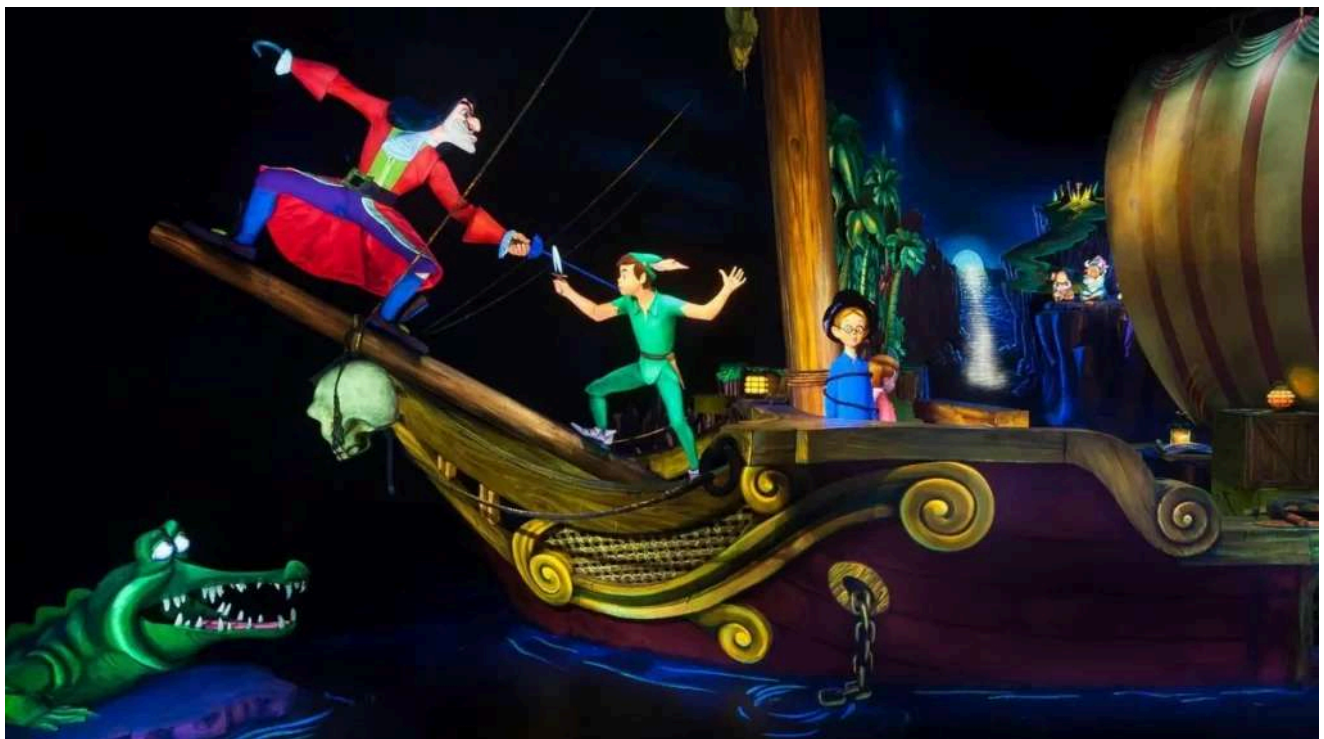
Embarque em um voo mágico sobre Londres e Terra do Nunca com Peter Pan.