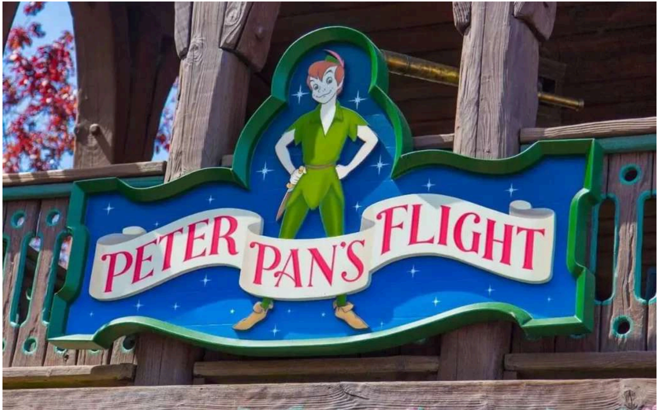
Peter Pan's Flight é uma das atrações mais encantadoras da Fantasyland.