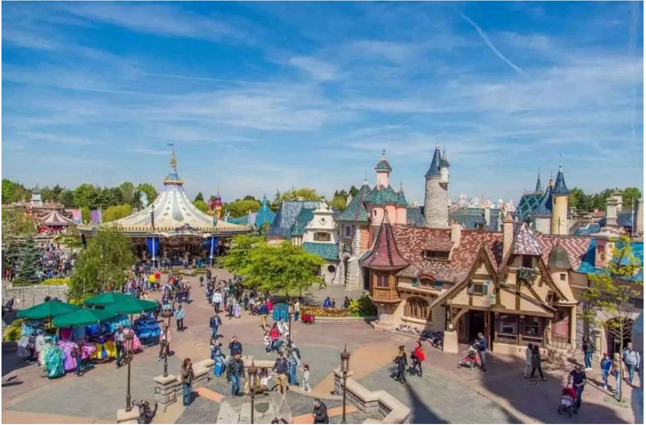
A mágica Fantasyland, lar das clássicas atrações infantis na Disneyland Paris 2026.