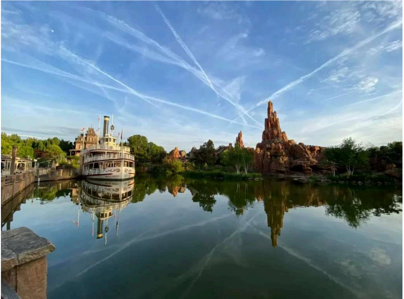
Um cruzeiro tranquilo pelo lago com paisagens do Velho Oeste.