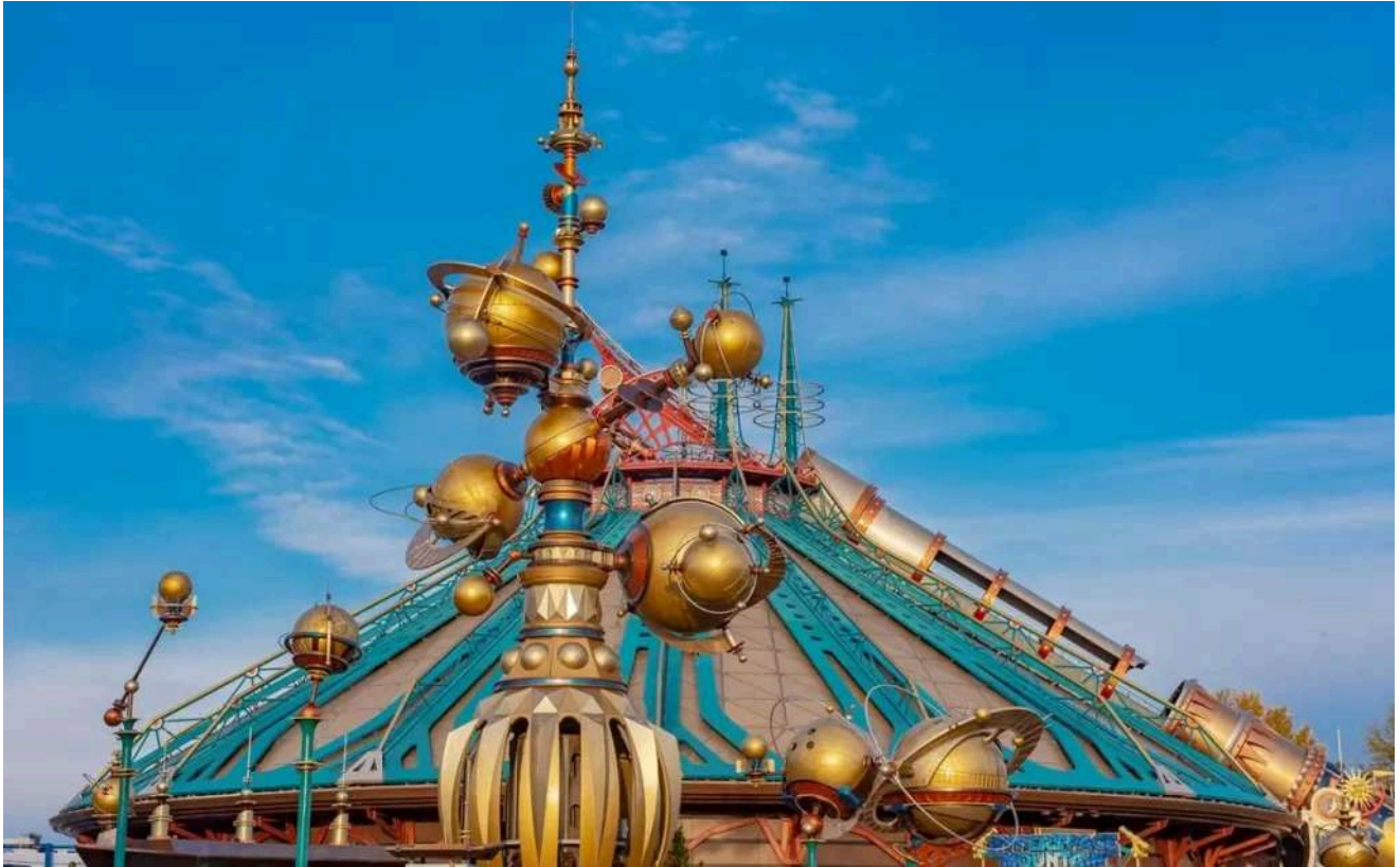
Discoveryland mistura ficção científica e aventuras intergalácticas em grande estilo.