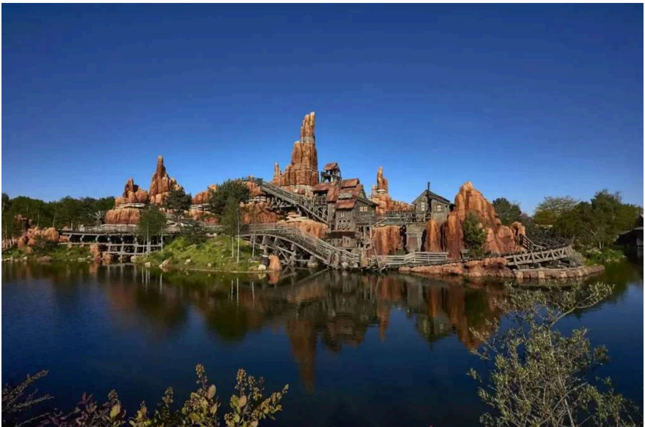
Um dos cenários mais fotogênicos da Disneyland Paris.