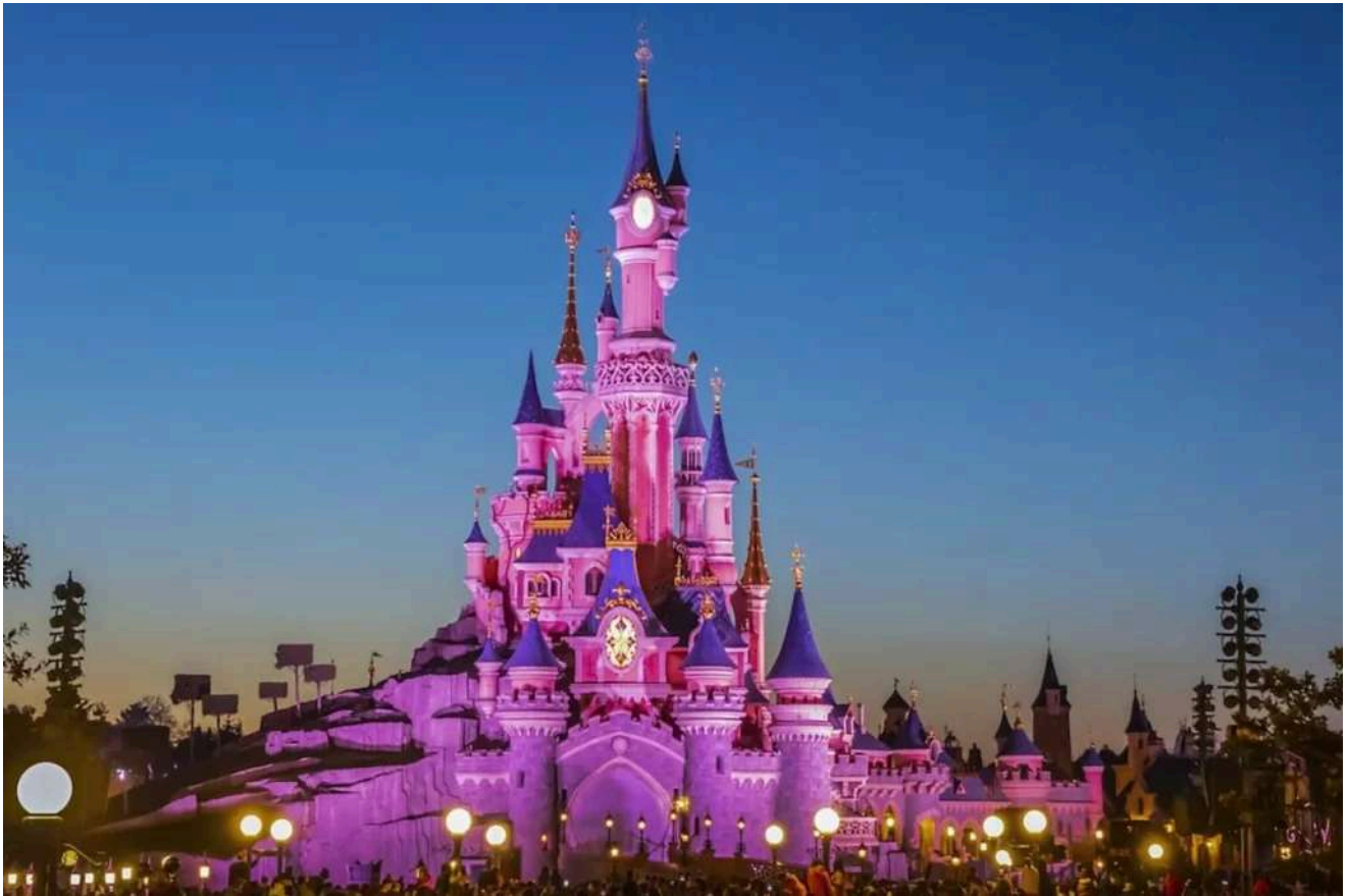
Ao anoitecer, o Castelo da Cinderella vira o grande palco dos shows.