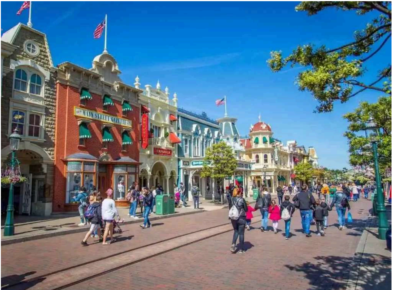
Rua principal repleta de lojas, vitrines temáticas e atmosfera nostálgica americana.