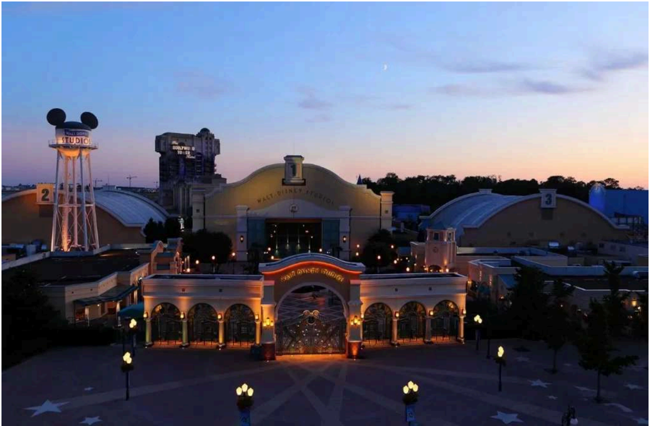
A magia do Walt Disney Studio Park ao anoitecer.