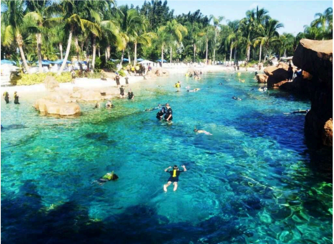
Visitantes praticando snorkel no Grand Reef do Discovery Cove.