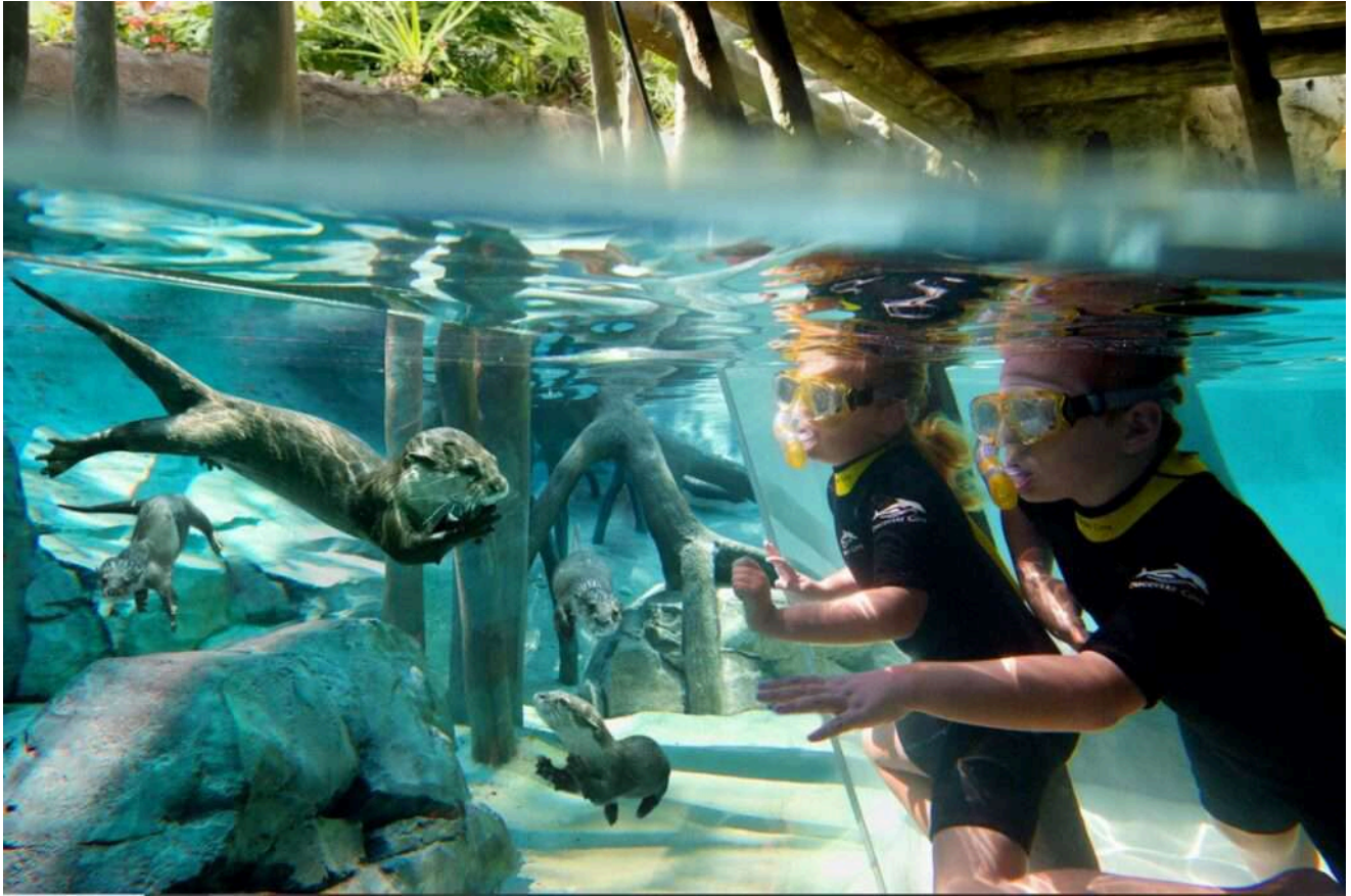
Crianças observando lontras no Freshwater Oasis, Discovery Cove.