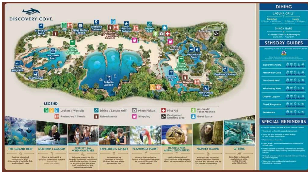
Mapa oficial com todas as atrações do Discovery Cove Orlando