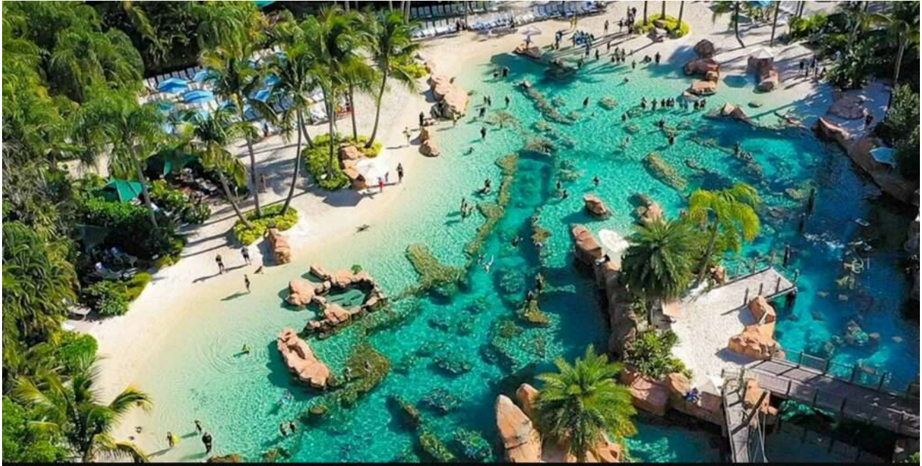
Vista aérea do Discovery Cove Orlando, com piscinas e vegetação tropical.

Diferente dos outros parques de Orlando, o Discovery Cove é íntimo e exclusivo: recebe no máximo 1300 visitantes por dia , e apenas 200 pessoas por dia podem participar da experiência de nado com os golfinhos.